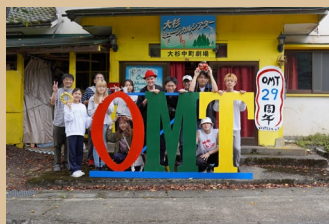
OMT活動拠点「大杉中町劇場」