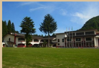
里山自然学校大杉みどりの里