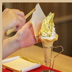
箔一大人気の金箔ソフト