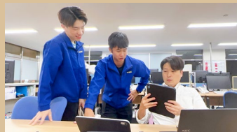
部署間の垣根が少ない