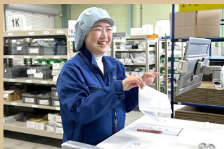
やりがいをもって働く社員たち