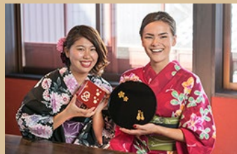
金箔貼り体験を楽しむ外国人観光客