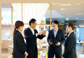
社員で話し合う様子