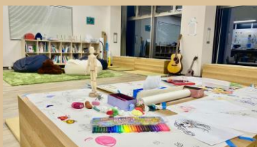
落書きコーナーやリラクゼーション