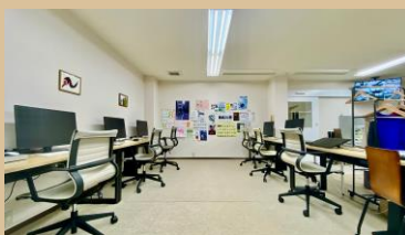
イラストや3D・映像制作などができる