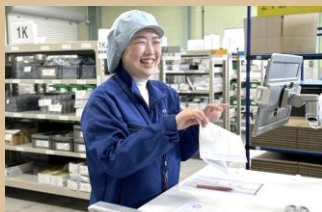
職場のKAIZENに取り組む社員