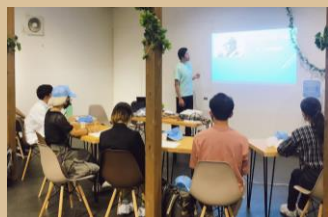
工場内に社員がDIYした休憩スペース