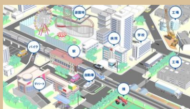
DIDの製品が使われている場所