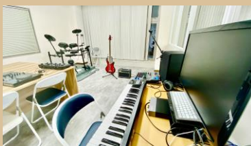
楽曲制作やDJ・楽器なども体験できる