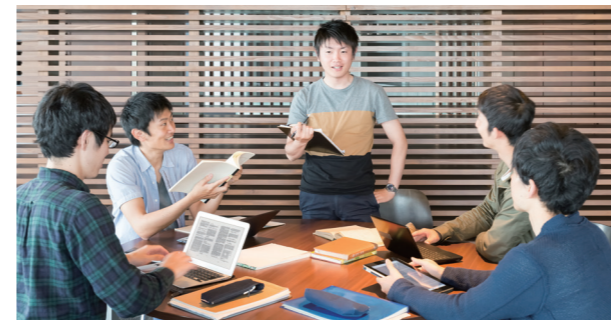
授業例【実践インターンシップ】

人間社会学域の学生は、科学技術系。理工/医薬保健学域の学生は、ヒューマンリテラシー系を履修することによって、異なる専門性を学び、複雑な未来課題に挑戦できる力を身につける。