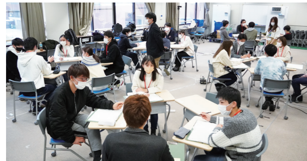
授業例【融合先導知実践演習(ちょこっとマイプロジェクト)】

身の回りの課題や関心をもとにした小さなアクション(=ちょこプロ)を通して、あなたの「やってみたくこと」を実現する3日間！